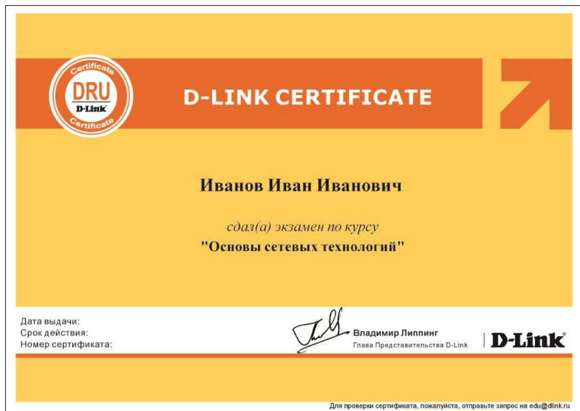
Рис. 2. Сертификат D-Link