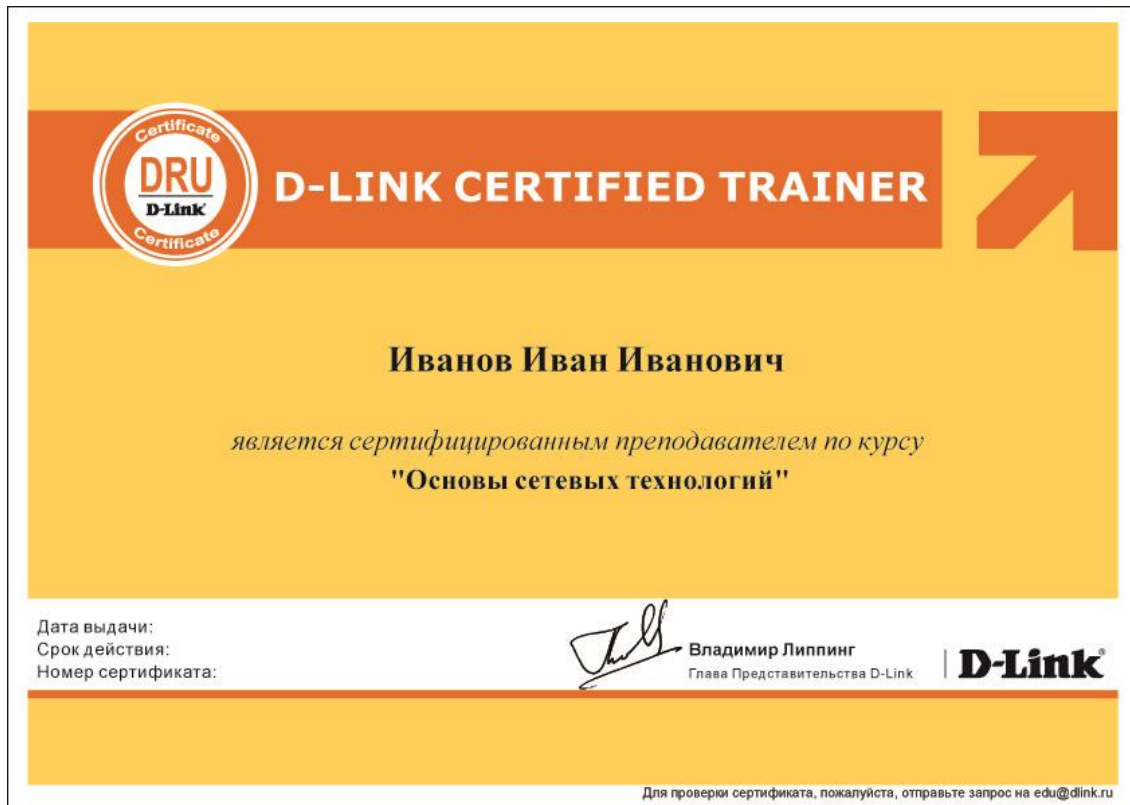
Рис. 1. Сертификат D-Link Certified Trainer

Срок действия сертификата D-Link – 3 года.